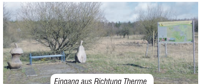
Eingang aus Richtung Therme