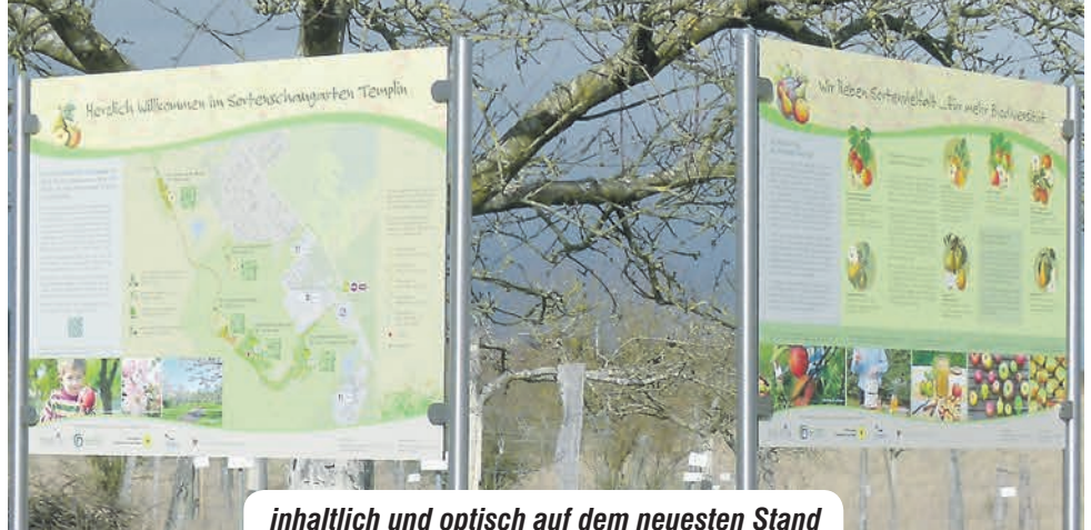
inhaltlich und optisch auf dem neuesten Stand