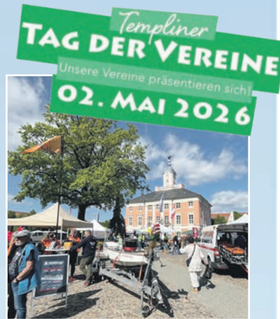
Rückblick Tag der Vereine 2025 | Foto: TMT

Meldet euch am Stand von Fortuna Templin 96 e. V. (Partnerverein des Stadtmauerfestes 2026) zum Beachvolleyball-Turnier auf dem Markt am 20. Juni an und sichert euch die Chance, eure Vereinskasse klingeln zu lassen.