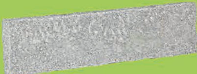
Granit Leistenstein 6/8x25x100cm gestockt/gehauen