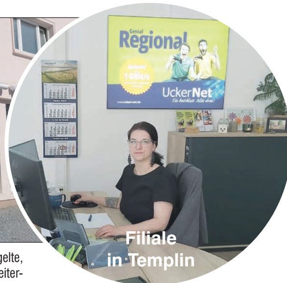
Filiale in Templin

maßnahmen sowie regional niedrigere Netzentgelte, deren Vorteil an die Kundinnen und Kunden weitergegeben wird.