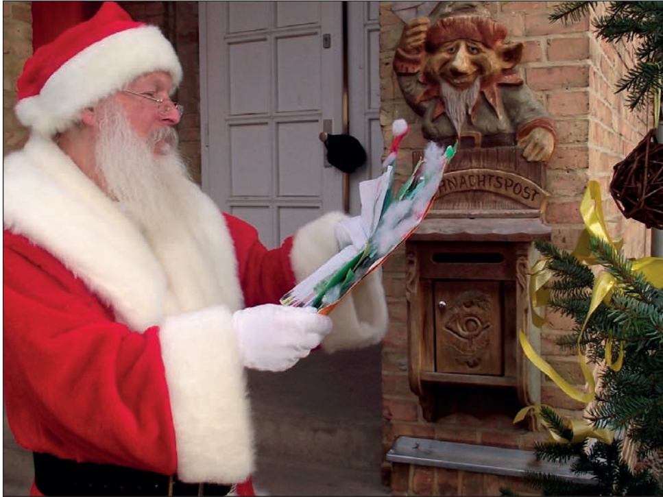
Viel Arbeit: Der Bärtige hat jede Menge Kinderbriefe zu beantworten

Dass der Weihnachtsmann auch schon im Sommer Post bekommt ist kein Geheimnis mehr. „Von Januar bis August dieses Jahres sind bereits rund