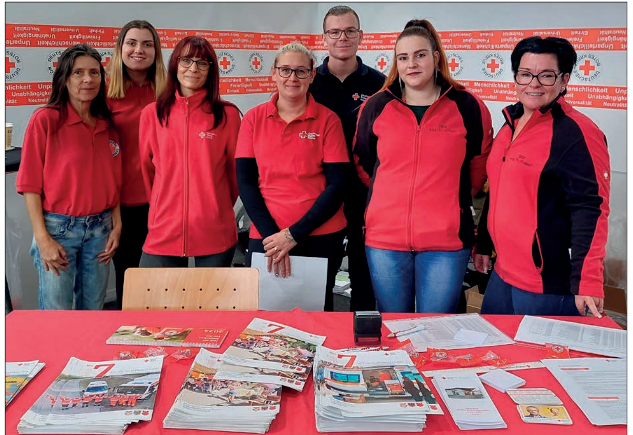
Unsere Messevertreter aus dem Altenpflegeheim Templin, aus der Wohnstätte Prenzlau sowie aus den Kitas Lychen und Prenzlau, auf der „vocatium“ Prenzlau.

Am 19. Oktober 2023 öffnete die Uckerseehalle in Prenzlau für rund 1300 Jugendliche die Türen zur „vocatium“ Fachmesse für Ausbildung+ Studium. Die Messebesucher konnten sich bei den 52 Ausstellern, darunter Ausbildungsbetriebe, Hochschulen, Fachschulen und Institutionen zu Informationsgesprächen anmelden. Ziel dieser Messe war es eine Orientierung für die Jugendliche zu schaffen, welche Möglichkeiten der Ausbildungsmarkt hier in der Region bereithält. Alle stellen sich die gleichen Fragen: Welche Ausbildung ist die richtige für mich? Wie kann ich ein Unternehmen auf mich aufmerksam machen? Bereits im Vorfeld wurden die Schülerinnen und Schüler im Unterricht auf die Gespräche vorbereitet, so dass sich jeder bei den entsprechenden Anbietern zu Gesprächen auf der „vocatium“ Messe anmelden konnte, um für sich diese Fragen beantwortet zu kommen. Auch wir, der Deutsches Rotes Kreuz Kreisverband Uckermark West/Oberbarnim e. V. war bei der „vocatium“ in Prenzlau vertreten. Unser DRK Kreisverband bietet dabei eine Vielzahl an Ausbildungsangeboten. Wir