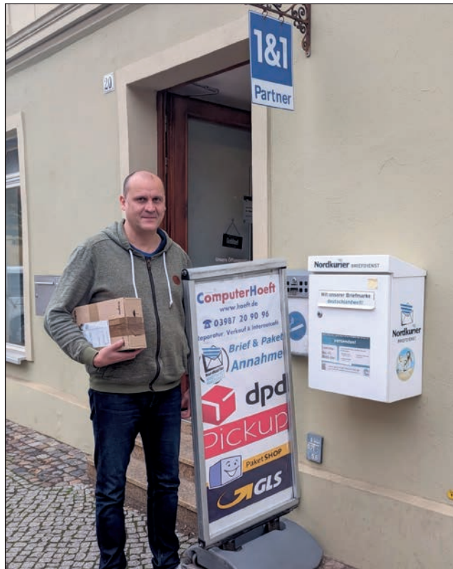
Neuer Service: Neben dem GLS-Paketshop und dem Nordkurier Briefdienst werden jetzt auch DPD-Pakete angenommen.

Für gewerbliche Kunden besteht nun auch die Möglichkeit bei größeren und teureren Anschaffungen, in Kooperation mit einem großen Leasing