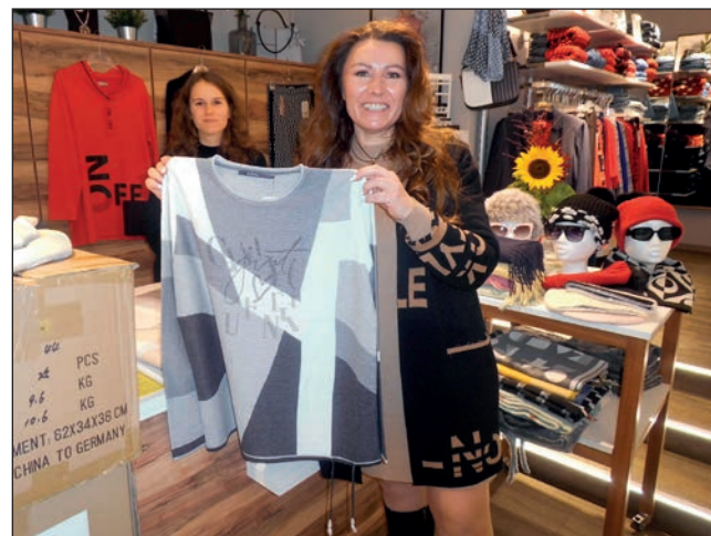
Es funkelt: Schicke Pullis zeigt die Geschäftsfrau auch bei der Modenschau.

wünschen sich die Geschäftsfrauen. Auch Single-Ladys seien herzlich willkommen. DJ Stanny legt passend zur Atmosphäre flotte Musik auf und ein Bingo-Gewinnspiel mit tollen Preisen verspricht einen weiteren Höhepunkt des Abends. Karten sind im Vorverkauf im Hotel und in der Boutique zum Preis von 40 Euro zu erhalten. An der Abendkasse kosten sie 45 Euro. Kontakt: 03987 4398 670 oder 03987 4941410.