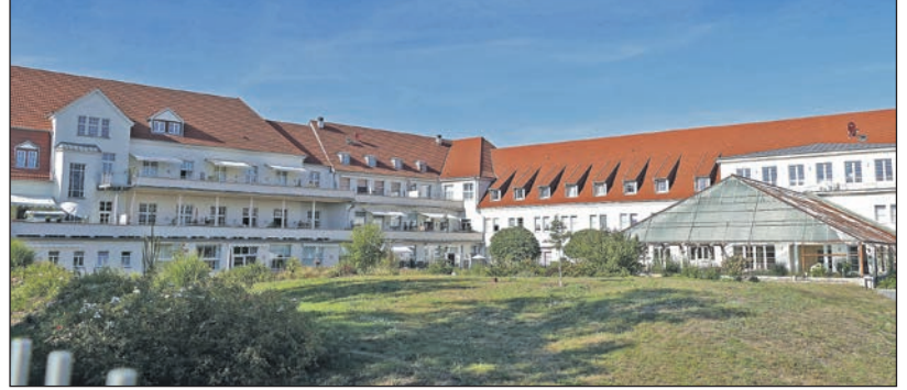
Sanierung gelungen: 2023 befinden sich an gleicher Stelle schicke Wohnungen.