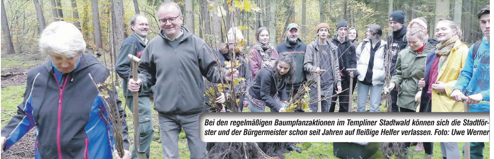
Bei den regelmäßigen Baumpflanzaktionen im Templiner Stadtwald können sich die Stadtförster und der Bürgermeister schon seit Jahren auf fleißige Helfer verlassen.

Dieses Jahr wird es Ihr schönster Weihnachtsbaum