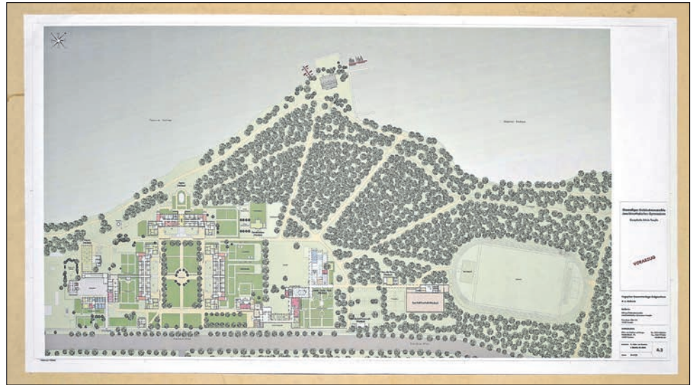
Eine der vielen Detailzeichnungen, die zum Masterplan gehören.

Bis zur Aufgabe der Immobilie in der Mitte der 1990er Jahre hatten in der Templiner Immobilie später unter anderem noch die Landesschule Templin (ab 1945), das Institut für Lehrerbildung (1955 – 1988), eine pädagogische Schule für Kindergärtnerinnen (1988 – 1991), eine Fachschule für Sozialpädagogik (bis 1992) und das Märkische Oberstufenzentrum (bis 1996) ihr Domizil.