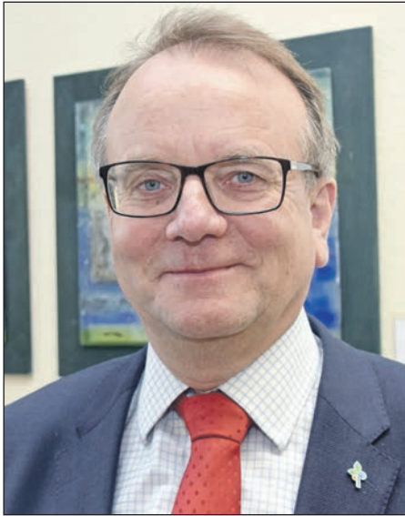
Bürgermeister Detlef Tabbert.

Templin (UW). Die Stadt Templin investiert in den Jahren 2023 und 2024 insgesamt rund 3,4 Millionen Euro im Bereich Straßenbau. Hinzu kommen rund 300.000 Euro für die Herrichtung von Parkflächen. Darüber informierte der Templiner Bürgermeister Detlef Tabbert. „Noch in diesem Jahr werden in der Stadt Templin drei Straßenbaumaßnahmen umgesetzt und ein Parkplatz mit 12 Stellplätzen an der Friedrich-Engels-