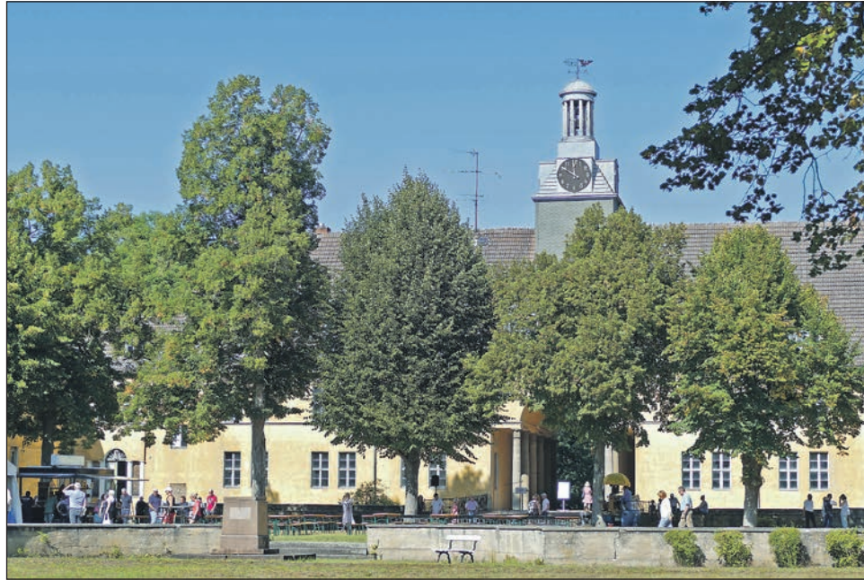
Zum Tag des Offenen Denkmals wollten sich zahlreiche Gäste über die Geschichte und den Fortschritt bei den Sanierungsarbeiten informieren.