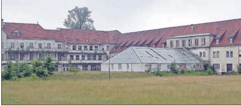
Nach Jahren des Verfalls: Das Heilstättengelände im Jahr 2017.