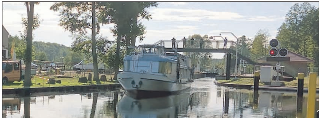
Die „Navette“ war das erste Fahrgastschiff, welches die neugebaute Schleuse passieren durfte.

Die Stadt Templin übernahm demnach die Planungen und Bauausführung der Schleusanlage und die Wasser- und Schifffahrtsverwaltung trägt weiterhin die Kosten der gesamten Maßnahme. Die Schleuse wurde in Lage und Abmessung gleich als Spundwand-Schleuse mit Schleusenhäuptern aus Massivbeton gebaut. Die Vorhäfen sind unter Berücksichtigung der aktuellen Sicherheitsanforde-