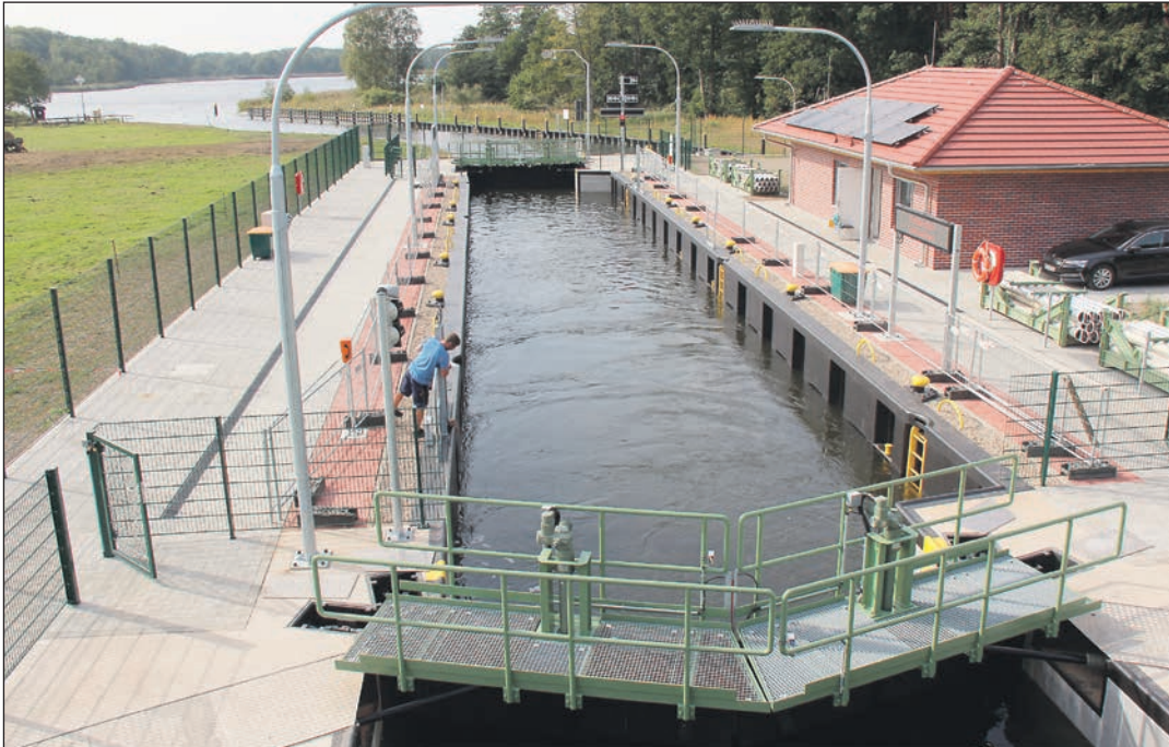
Die Schleuse Kannenburg, eine moderne Selbstbedienungsschleuse. Modernste Technik unterstützt die Bootsführer künftig beim Schleusen. Die Zentrale in Zehdenick überwacht den Betrieb.

Templin. Sechs Jahre waren die Templiner Gewässer vom übrigen Wasserstraßennetz getrennt. Der Grund: Die Schleuse Kannenburg musste aufgrund erheblicher baulicher Mängel gesperrt werden. In der damaligen Prognose der Wasser- und Schifffahrtsverwaltung des Bundes hieß es, ein Neubau könne nicht vor 2035 erfolgen. Die Stadt Templin nahm die Aufgaben als Bauherr für den Neubau selbst in die Hand.