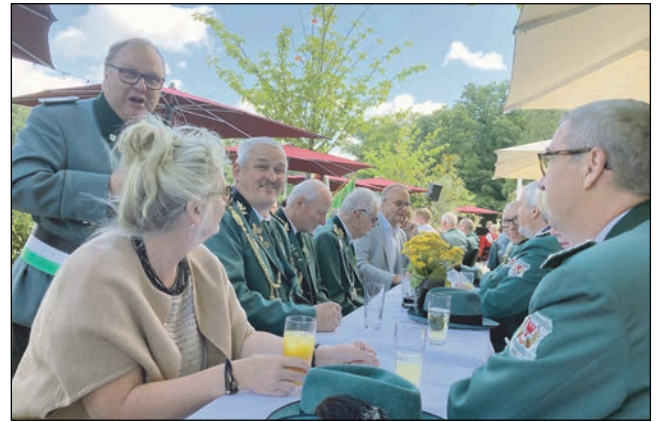
Mitglieder des Schützenvereins 1810 e.V. aus Templin waren als Ehrengäste geladen und bekräftigten die Verbundenheit beider Schützenvereine.