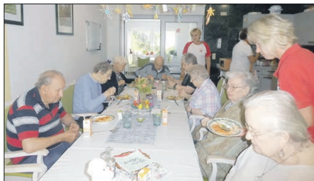
In Gemeinschaft: Das Mittagessen ist ein festes Ritual in der Einrichtung.

Am Stadtrand von Lychen hat sich die Tagespflege des DRK Kreisverband Uckermark West/