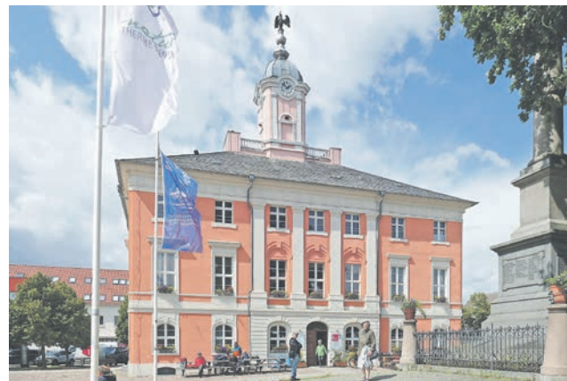
Die Tourist-Information im Historischen Rathaus von Templin wird von vielen Tagesgästen und Urlaubern besucht.

Gegenwärtig laufen bei der Tourismus Marketing Templin GmbH die Vorbereitungen für die Herausgabe des gemeinsamen Reisemagazins für die Regionen Templin und Lychen im Jahr 2024. „Demnächst werden von uns alle in Frage kommenden touristischen Leistungsträger angeschrieben, damit sie ihre Wünsche einbringen können“, kündigte Verena Beeskow an.