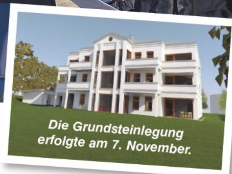
Die Grundsteinlegung erfolgte am 7. November.

gerung gab es bei der Erteilung der Baugenehmigung, weil der Bauungsplan geändert werden musste. Das Ziel der WOBA noch in diesem Jahr die Bodenplatte fertig zu stellen, wird durch die engagierte Arbeit der Bauleute von Grafe-Bau erreicht. Das Richtfest ist