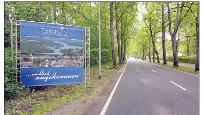
Werbefläche an den Ortseingängen Templins