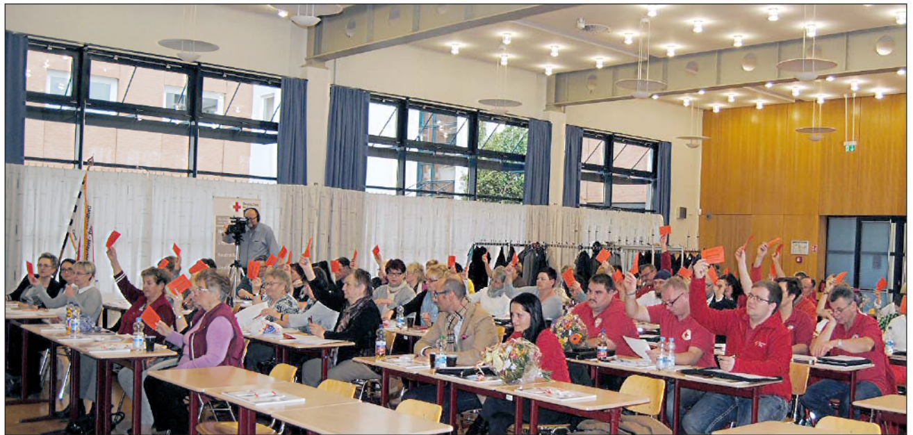
Am 18. November 2017 nahmen 69 Delegierte an der XXIX. DRK Kreisverbandsversammlung teil.