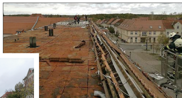
Große Teile der Dachhaut landeten auf der Straße, direkt vor dem Marktplatz.

den. Fünf Wohnungen in der obersten Etage des Hauses wurden aufgrund des massiven Wassereintritts unbewohnbar, die Mieter mussten in Ersatz-