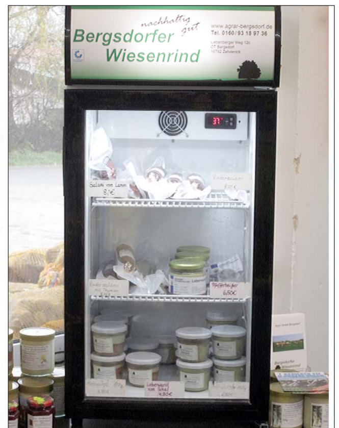
Neu im Angebot sind Wurst und Fleisch vom Bergsdorfer Wiesenrind der Agrar GmbH Bergsdorf bei Zehdenick.

Öffnungszeiten: Mo - Fr: 9 - 18 Uhr und Sa: 9 - 12 Uhr