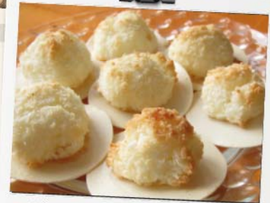
Mmmmh... Makronen wie jedes Jahr

Von guten Mächten treu und still umgeben, behütet und getröstet wunderbar, so will ich diese Tage mit euch leben und mit euch gehen in ein neues Jahr.