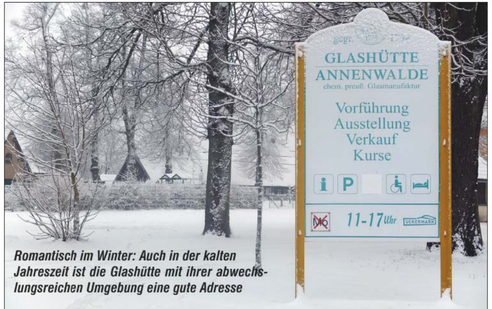
Romantisch im Winter: Auch in der kalten Jahreszeit ist die Glashütte mit ihrer abwechslungsreichen Umgebung eine gute Adresse

etwa zehn Stunden. Bevor die Gruppe zum gemütlichen Teil des Abends in das gegenüber liegende Restaurant „Kleine Schorfheide“ weiter zieht, werden alle Handys aktiviert.