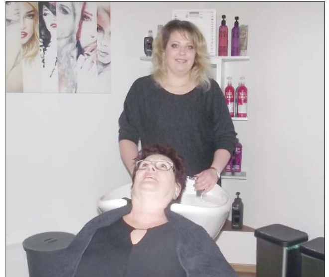
Zum verwöhnen: In ihrem modern eingerichteten Geschäft können die Kunden prima entspannen.

möchte, braucht den Salon nicht zu verlassen. Die junge Geschäftsfrau ist auch Nageldesignerin und Visagistin. Zu ihren Dienstleistungen gehören