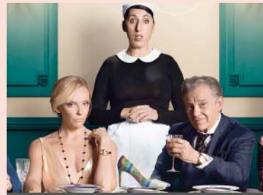
Kino „Madame“ ab Sa, 16.12.2017