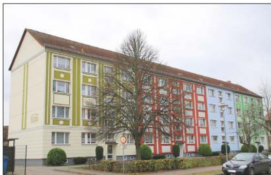
Die neue Fassade des Blocks in der Prenzlauer Allee.