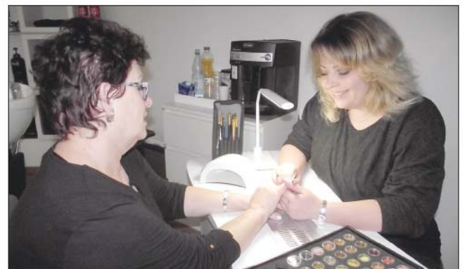
Fingerfertig: Auch ihre Nägel können sich die Kunden von der Geschäftsfrau schick machen lassen.