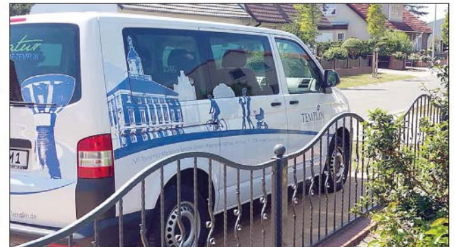
Transporter der TourismusMarketing Templin (TMT)