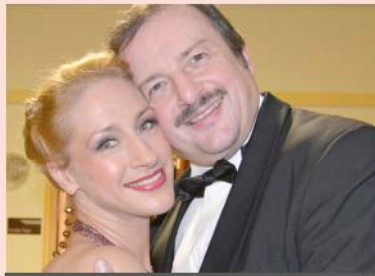
Konzert „Champagner ist ein Feuerwein“ Sa, 06.01.2018