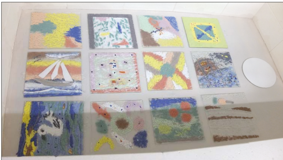
Tolles Ergebnis: Kunstwerke vor dem Verschmelzen in der Fusingtechnik

legen und bei 730 Grad absensken. Auch dieser Vorgang, den der Fachmann Slamping nennt, dauert rund zehn Stunden. Die Kreativen dieses Abends dürfen also gespannt sein auf das Ergebnis. Denn Vorfreude ist ja besonders im Advent die schönste Freude.