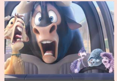
Kinderfilm „Ferdinand - Geht STIERisch ab!“ ab Do, 28.12.2017