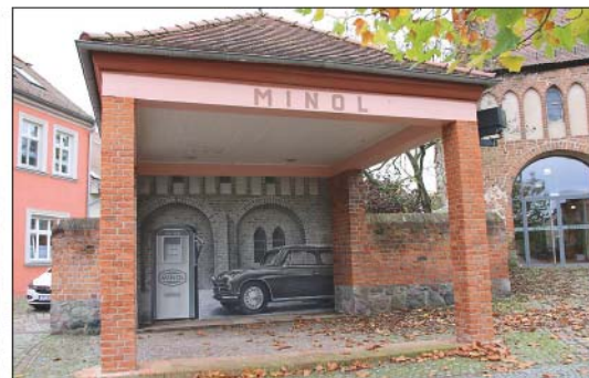
Die Gestaltung der alten Tankstelle ist bei Touristen ein Fotomotiv.