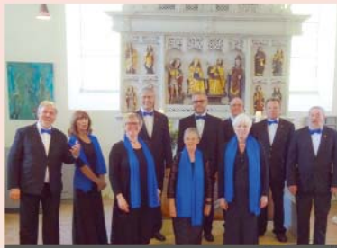
Konzert „Weihnachtsoratorium - Collegium vocale Templin“ Fr, 22.12.2017