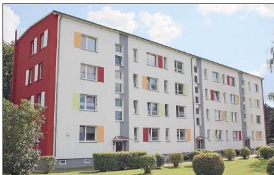
Der Block in der Röddeliner Straße ist nun ein „Hingucker“.

WOBA gestaltet unansehnliche Fassaden und Giebel zu „Hinguckern“