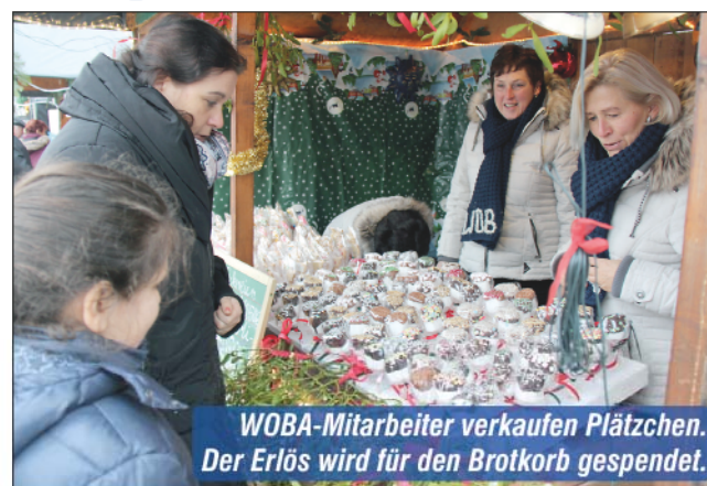
WOBA-Mitarbeiter verkaufen Plätzchen. Der Erlös wird für den Brotkorb gespendet.

In der Weihnachtszeit sind die Mitmenschen oft stärker im Blickfeld als zu anderen Zeiten im Jahr. Die Mitarbeiterinnen der WOBA haben sich etwas ganz Besonderes einfallen lassen. Gemeinsam mit Mädchen und Jungen von der Goetheschule und mit Unterstützung des „Teams für offene Kinder- und Jugendarbeit Villa 2.0“ wurden Honigkuchen gebacken und auch